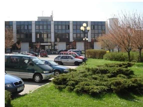
Euroregion Glacensis, správce a administrátor Fondu mikroprojektů pro region Královéhradeckého kraje, Rychnov nad Kněžnou