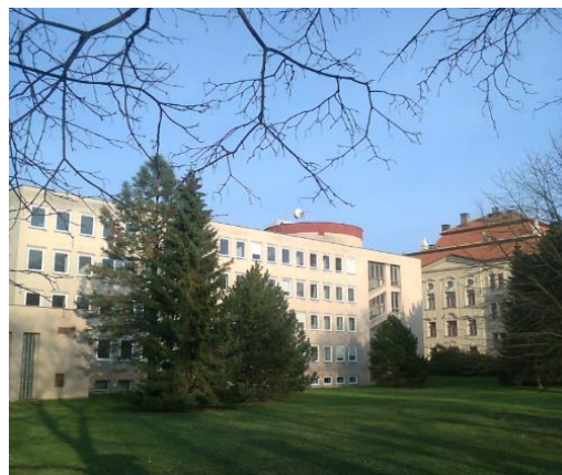
Centrum pro regionální rozvoj ČR - pobočka pro NUTS II Severovýchod Hradec Králové