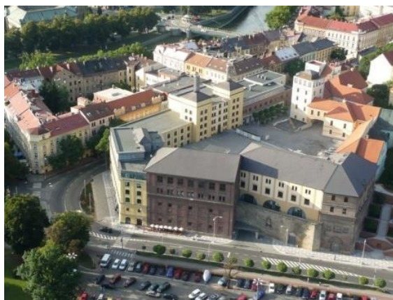
Regionální subjekt pro region Královéhradeckého kraje - Královéhradecký kraj