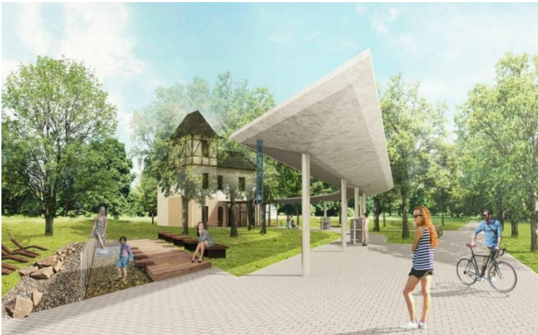
projekt Aqua Mineralis Glacensis (vizualizace)