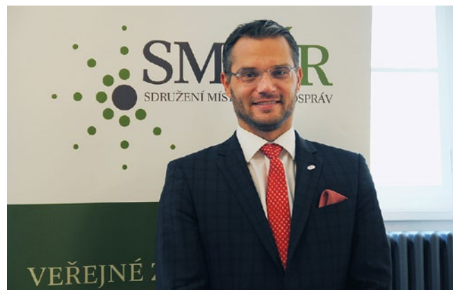
Stanislav Polčák předseda Sdružení místních samospráv ČR

Za SMS ČR také závěrem deklarujeme podporu změně financování krajů, jejich zvýšenému podílu na daních a zavedení skutečného systému dělení krajského RUD – sdílených daní. Vracíme tím krajům podporu, které se od nich obcím dostalo při dosavadních změnách obecního RUD.