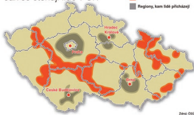
Tabulka 1: Počet seniorů v letech 2016 až 2019 v jednotlivých velikostních kategoriích