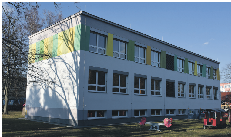
Budova MŠ Slunečnice v Hradci Králové.

Všechny uvedené projekty administrovalo Centrum investic, rozvoje a inovací (CIRI). |