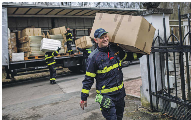
Koordinátorem ubytování uprchlíků je krajský hasičský záchranný sbor, který se podílí také na přípravě ubytovacích prostorů.

V regionu se nadále hledá co největší počet míst pro ubyto-