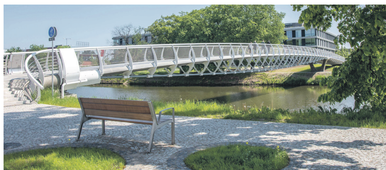
Lávka přes Labe v Hradci Králové.

Zvláštní cenu poroty si v kategorii občanské a bytové stavby odnesl Kulturní dům Kvasiny. Nový objekt tvoří dvě samostatné části: obecní úřad s knihovnou a kulturní dům. Obě části jsou provozně