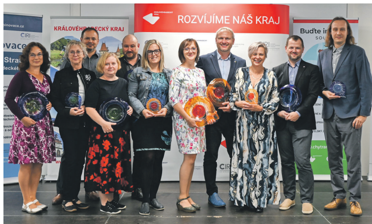
Všichni ocenění v soutěži Buďte inspirací .

Soutěž vyhlašuje Regionální stálá konference Královéhradeckého kraje, což je platforma regionálních partnerů napomáhající lepší koordinaci aktivit